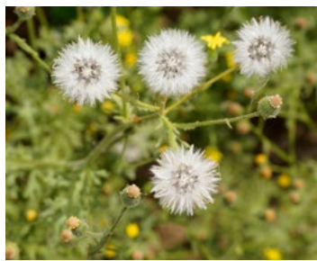
Udo Schmidt (CC BY-SA 2.0)