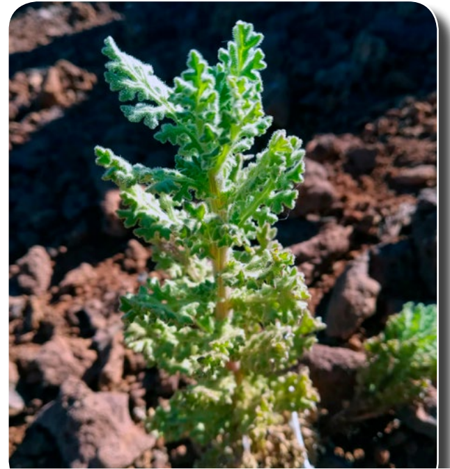
Planta adulta sin flor.